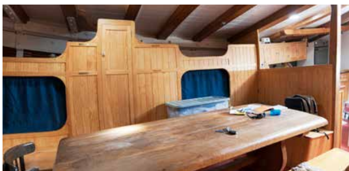
Trois vues du carré